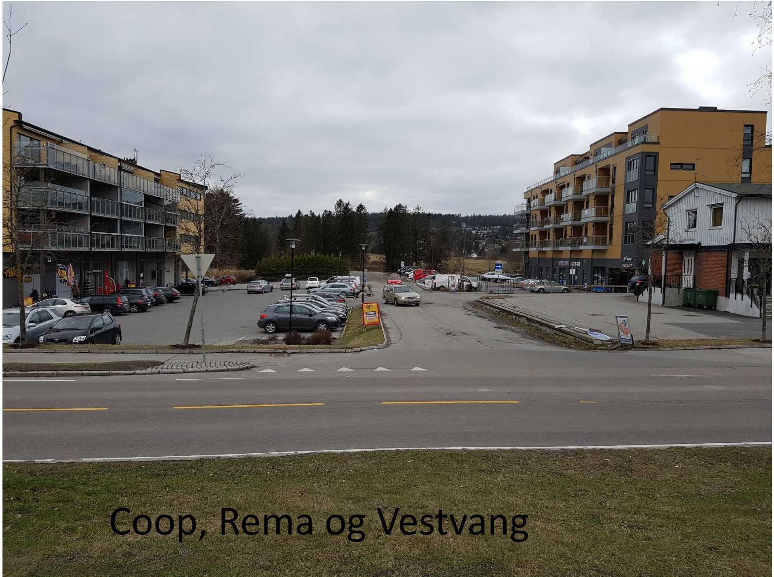
Coop, Rema og Vestvang